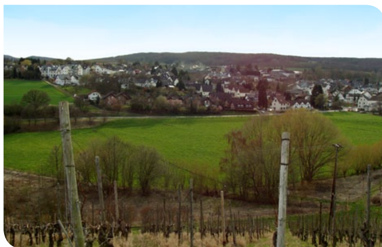
Blick über die Ortschaft Lantershofen.