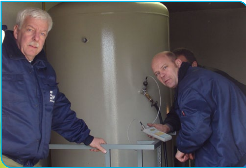
Kontrollarbeiten an einer Druckerhöhungsstation bei der EURAWASSER in Grafschaff.

eine einheitliche Abrechnung der Gebühren und der wiederkehrenden Beiträge erhalten.