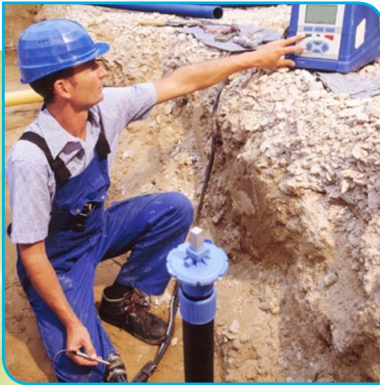
Wichtige Arbeiten beim Ausbau der Infrastruktur.

Eigenbetrieb – Stadtwerke – Abwasser-Oestrich-Winkel (12.000 EW). Die 1996 bis 1998 umgebaute Kläranlage erfüllt sehr zuverlässig die besonderen Anforderungen zur Einleitung in den Rhein besonders während der Weinkampagne.