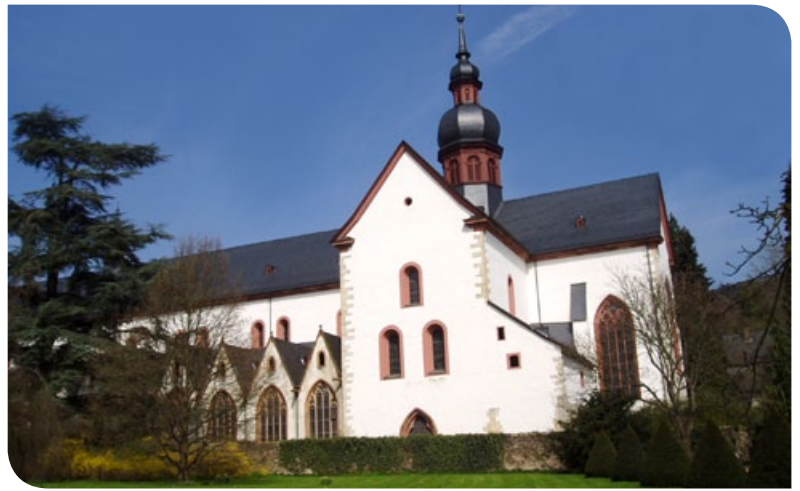
Das weltberühmte Kloster Eberbach.

■ Die EURAWASSER sichert seit dem 1. Januar 2009 die Betriebsführung für die Rheingauwasser GmbH und den Abwasserverband Oberer Rheingau in Eltville am Rhein.