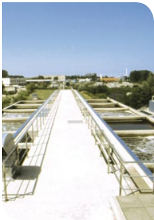
Auf der Zentralen Kläranlage Rostock.

■ Die EURAWASSER Nord GmbH versorgt in Mecklenburg-Vorpommern insgesamt 311 000 Menschen, d.h. jeden fünften Einwohner, mit Trinkwasser und ist damit der größte Wasserversorger im Bundesland. Das Unternehmen entstand am 1. September 2003 aus der Fusion der EURAWASSER GmbH Rostock und der EURAWASSER Mecklenburg GmbH: Als Vertragspartner des Warnow-Wasser- und Abwasserverbandes (WWAV) und des Wasserversorgungs- und Abwasserzweckverbandes Güstrow-Bützow-Sternberg (WAZ) wird die Wasserversorgung und Abwasserbeseitigung im Großraum Rostock-Güstrow sichergestellt.