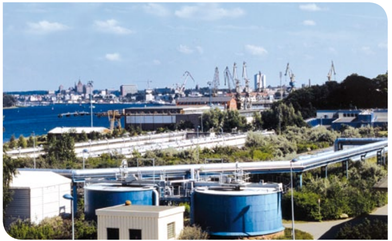
Zentrale Kläranlage Rostock.