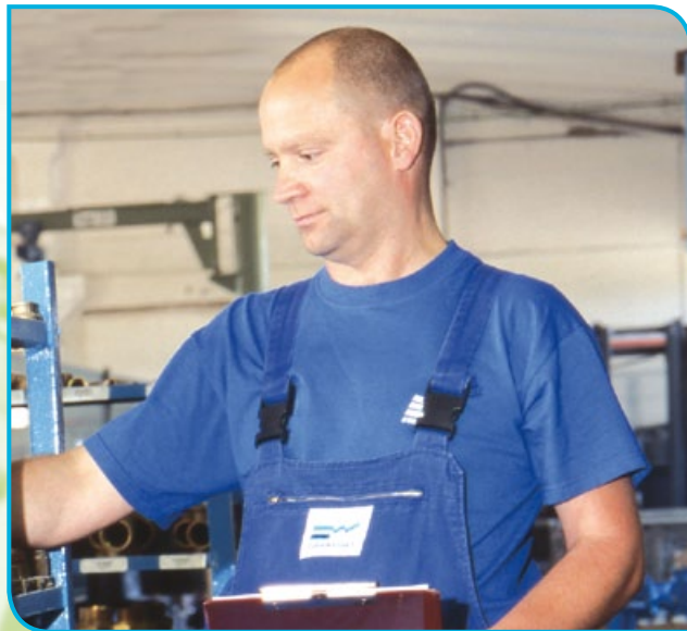
Im Lager am EURAWASSER-Standort Freyburg.

leitung im Oktober 2004. Durch den Anschluss an die neue Fernwasserleitung können seit Anfang 2005 rund 2 300 Haushalte am EURAWASSER-Standort Freyburg im Südwesten von Sachsen-Anhalt besseres Trinkwasser genießen: Die neue Fernwasserleitung bringt »weiches« Harzwasser aus dem Rappbode-Talsperrensystem in die Kleinstadt. Baubeginn für die elf Kilometer messende Verlängerung der Leitung war im November 2003. Das gemeinsame Projekt des Trinkwasserversorgungszweckverbandes Saale-Unstrut, der Fernwasserversorgung Elbaue-Ostharz GmbH und der EURAWASSER hatte ein Gesamtvolumen von fünf Millionen Euro und wurde planmäßig abgeschlossen, die Leitung im Oktober 2004 mit einem Wasserfest feierlich eingeweiht. Der Anschluss war aufgrund der Nitratbelastung und des hohen Kalkgehalts der Brunnen in Freyburg nötig geworden.