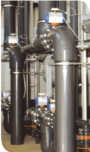
Rohwasseraufbereitung in Freyburg.

■ Das Engagement im Burgenlandkreis (Sachsen-Anhalt) begann im Jahre 2002. Das Versorgungsgebiet mit insgesamt 38 000 Einwohnern umfasst die Städte Bad Kösen, Freyburg, Laucha, Nebra und Bad Bibra sowie 37 weitere Gemeinden. Der Vertragspartner ist der Trinkwasserversorgungszweckverband Saale-Unstrut (TWVZV). Beide Vertragspartner haben dafür im Januar 2002 im Rahmen eines Kooperationsmodells eine gemeinsame Gesellschaft, die Trinkwasserversorgung Saale-Unstrut GmbH (TWV), gegründet. An der Gesellschaft sind der Zweckverband mit 74,9 Prozent und die EURAWASSER Aufbereitungs- und Entsorgungsgesellschaft Saale-Unstrut mbH mit 25,1 Prozent beteiligt. Alle hoheitlichen Befugnisse und kommunalen Entscheidungsrechte verbleiben jedoch beim Trinkwasserzweckverband Saale-Unstrut.