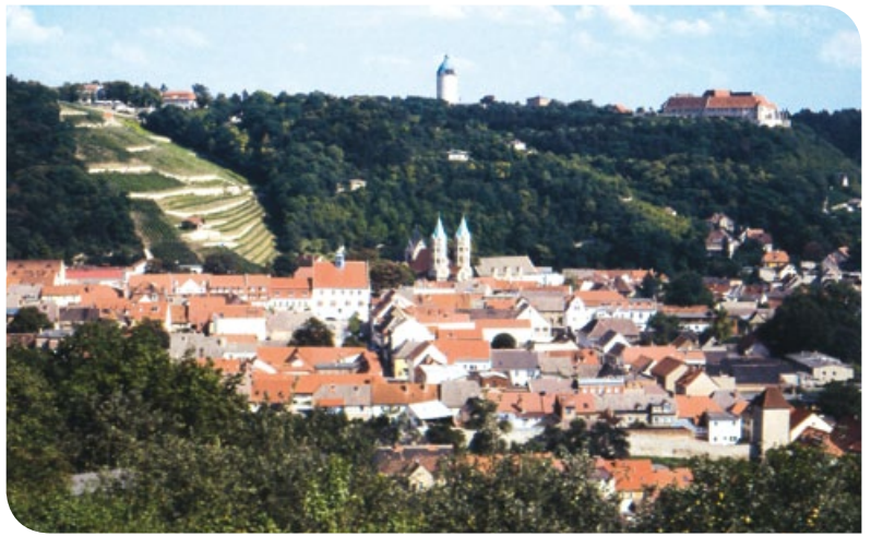
Blick auf Freyburg.